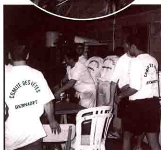
Les jeunes en action ... et les Bernadétois en action