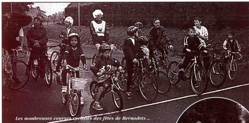
Les nombreuses courses cyclistes des fêtes de Bernadets ...

Au moment de vous faire revivre ces instants en images, nous tenons à féliciter et à remercier toute l'équipe des jeunes qui s'est mobilisée avec grand enthousiasme pour le bonheur de tous.