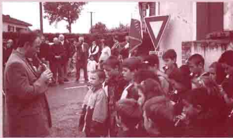
Les enfants de l'école interprètent la Marseillaise.