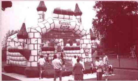
Le château gonflable a rencontré un franc succès ...