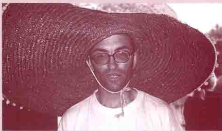
Le mexicain de Bernadets a eu du mal à digérer la côte

C'est le samedi 25 mars que s'est déroulée la soirée cabaret de cette année 2000.