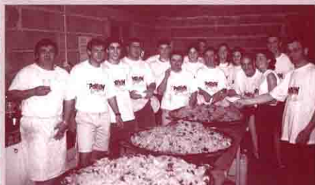
La paella avant le service.