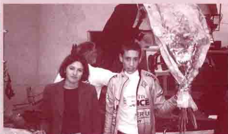
Le vainqueur de la "vrai" course cycliste