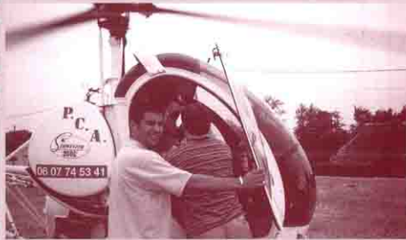
... tout comme le baptême en hélicoptère.