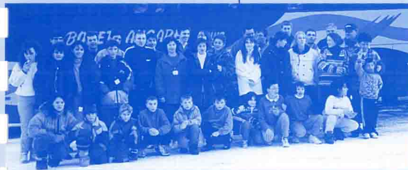
Les participants à la sortie de SKI DE FOND 1998 posent devant le car.