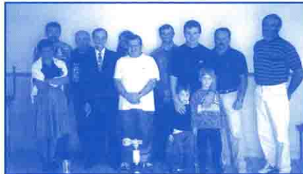
▲ LeM.C.B. a remercié la municipalité.

A ce sujet, un nouveau panneau va être installé, où l'on pourra lire : « l'utilisation du terrain de moto-cross, avant et après les manifestations, et pendant la saison de chasse, est formellement interdite. La municipalité et le Moto Club du Béarn, déclinent toute responsabilité en cas d'accidents. »